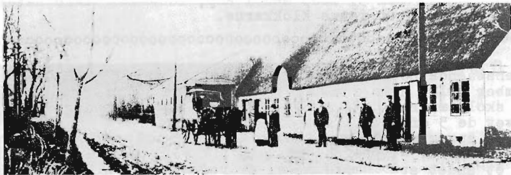
Postvognen fra Rødding ankommer, og fodposten er klar

Lintrup gamle kro, en ret stor og rummelig bygning, lå, hvor den nuværende kro ligger, Den var kendetegnet af et meget højt stråtag. I hjørnet ved rejsestalden var der købmandshandel med to firedelte vinduer og en jernstang foran, som man kunne binde en hest til. Gennem døren kom man ind i en lille forstue med tre døre, en til butikken, en til loftstrappen og en til skænkestuen. Butikken var fyldt med alt, hvad der hørte en landhandel til. Bag disken var skuffer med mel, gryn, svesker, rosiner, sukker, salt og soda. Man kunne nemt gå hen og tage fejl. Engang fik et større selskab soda i stedet for salt i suppen. På gulvet var der margarine i bøtter og smør i dritler. Klipfisk og tjæret reb lå i stabler. Lugten af gammel ost og sure sild blandede sig med de andre dufte. Brændevin tappedes på flasker og i skægmænd, det var dunke af stentøj. Det var en rigtig blandet landhandel, hvor man kunne få alt. Bad man om 3 til 20, betød det 3 cigarer til 20 pfenig.