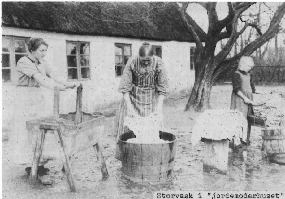
Storvask i "jordemoderhuset"